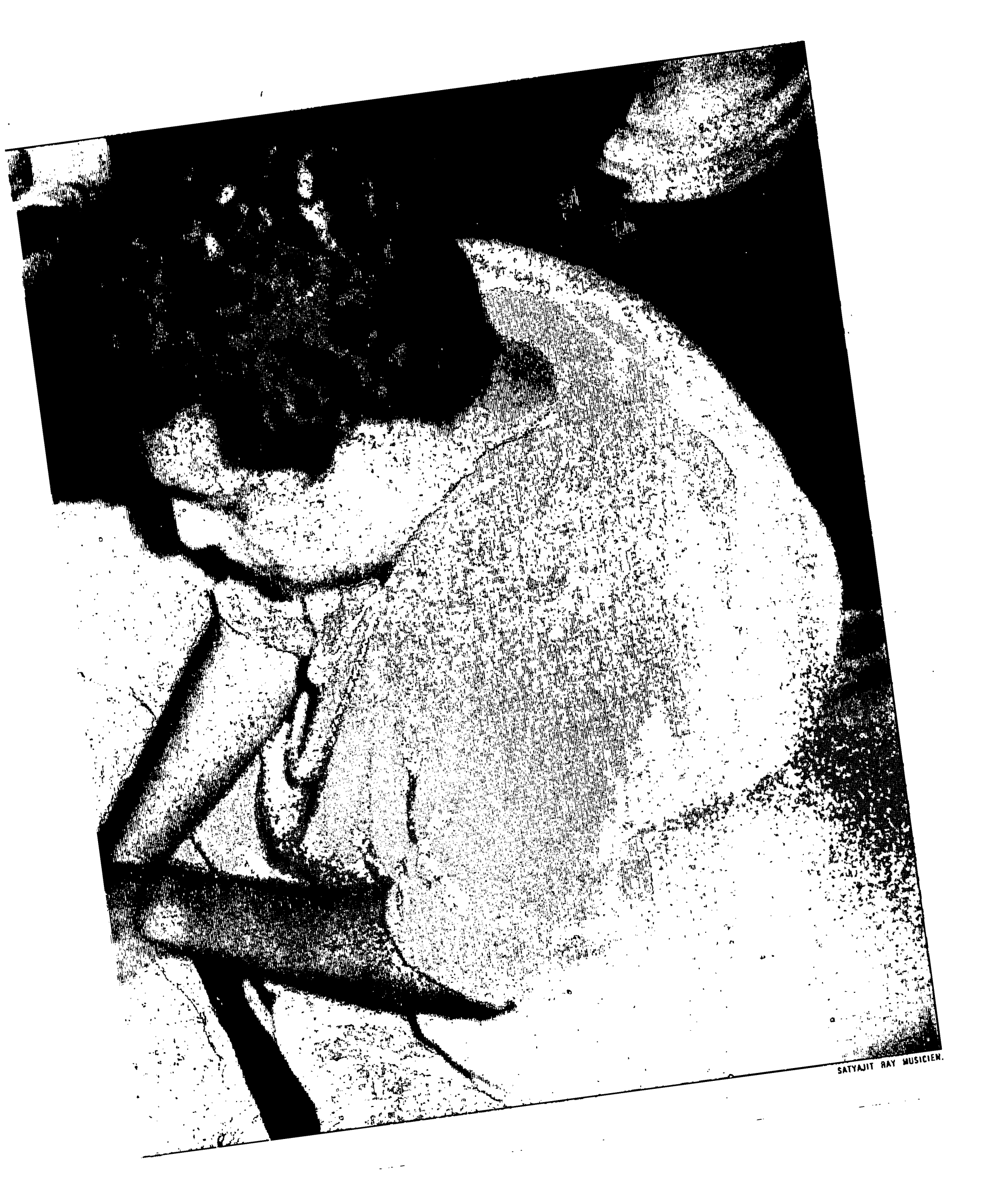
SATYAJIT RAY MUSICIEN.